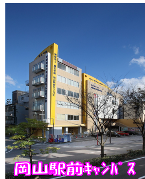
岡山駅前キャンパス