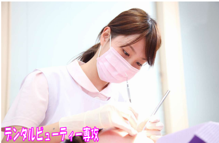
デンタルビューティー専攻