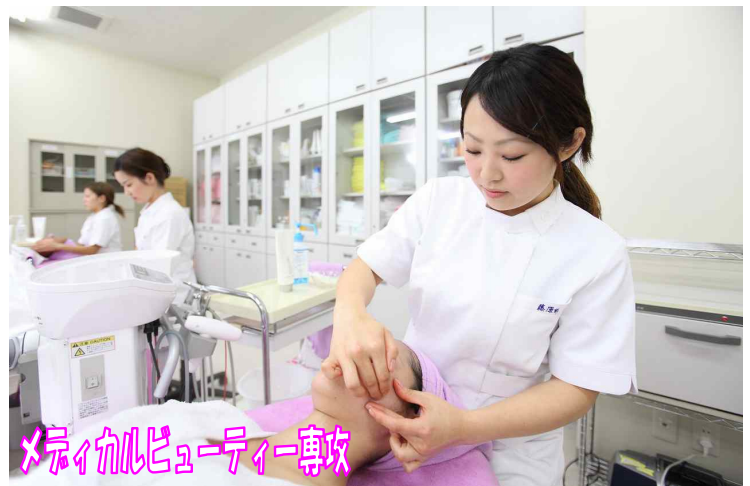
メディカルビューティー専攻